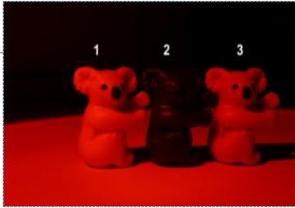
Photo prise en lumière rouge