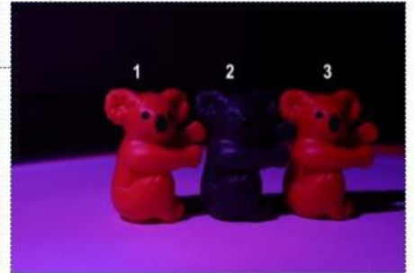
Photo prise en lumière magenta